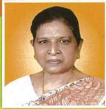
रेणु देवी उपमुख्यमंत्री, बिहार