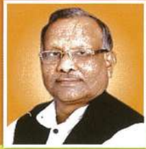
तारकिशोर प्रसाद उपमुख्यमंत्री, बिहार