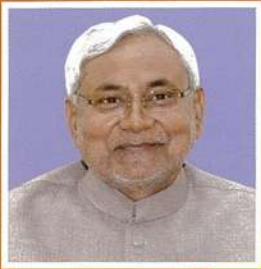
नीतीश कुमार मुख्यमंत्री, बिहार